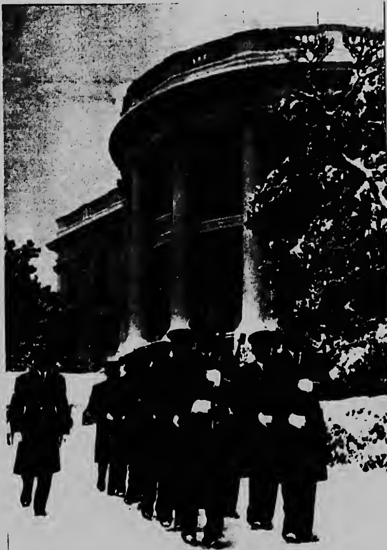
No obstante cu e tormenta di sneeuw cu ta azota Washington ta casi un orcan di sneeuw, miembronan di infanteria mester a tene un parade ora cu e embahadornan di Yemen y Yalta a bai presenta nan cartanan credencial serca presidente Johnson